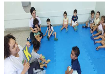
Inicial do nome Intencionalidade: Conhecer e identificar a letra inicial do nome.