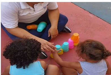
Pirâmide em grupo

Intencionalidade: Estimular o trabalho em equipe