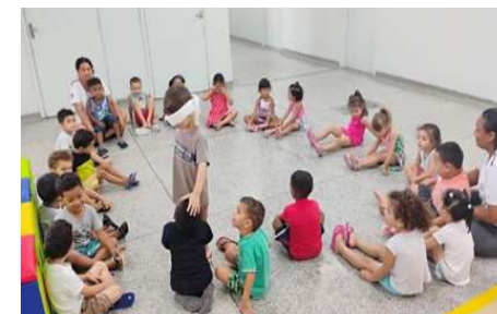
Pega – Pega (Auditivo)

Intencionalidade: Aprender a cooperar e respeitar o outro.