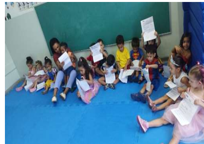
Pesquisa da cultura familiar Intencionalidade: Conhecer a cultura de cada família.