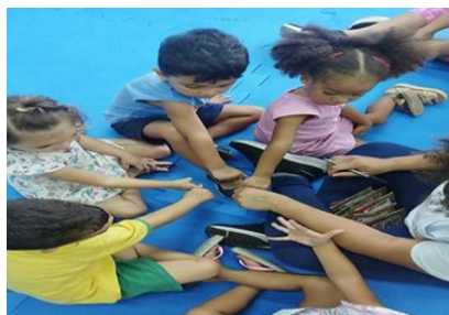
Coração da Saudade

Intencionalidade: Estimular o trabalho em equipe