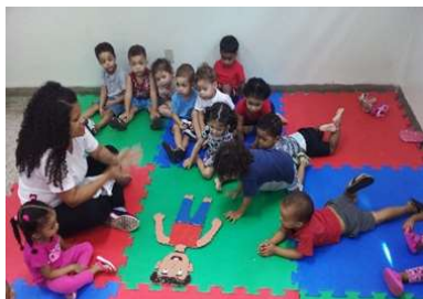
Quebra – Cabeça do corpo humano Intencionalidade: Conhecer as parte do corpo.