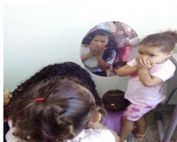
Imitando as expressões faciais Intencionalidade: Desenvolver as expressões faciais e emocionais