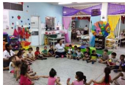
Musicalização: A onda do Mar

Intencionalidade: Sempre que sentir saudade da família beijar o coração